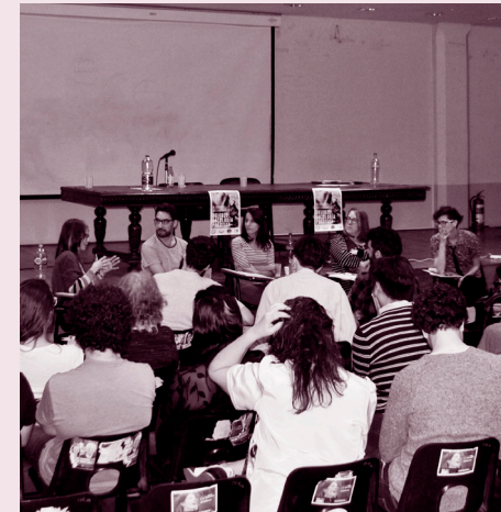
Conversatorio: Géneros, feminismo y diversidad

La última ronda de ponencias del martes comenzó con la presentación de Marc Rölli (HGB - Leipzig), quien analizó la potencia del concepto deleuziano de repetición a través de una lectura centrada en una comparación entre Deleuze y Foucault, mostrando cómo cada uno se aboca al estudio de diferentes dimensiones —aunque complementarias— del fenómeno del poder. Le siguió Cristóbal Durán Rojas (UNAB - Santiago de Chile), quien presentó una lectura cruzada sobre el concepto de continuidad entre el Leibniz deleuziano, donde aquella aparece como pliegue , y el Kafka deleuzo-guattariano, donde la continuidad es descrita como contigüidad , presentando así dos modelos para pensar lógicas de conexión entre vecindades heterogéneas. Finalmente, Daniel Smith (Purdue University - Indiana) realizó un análisis acerca del concepto deleuziano de “falsedad”, sus relaciones con lo “verdadero”, y